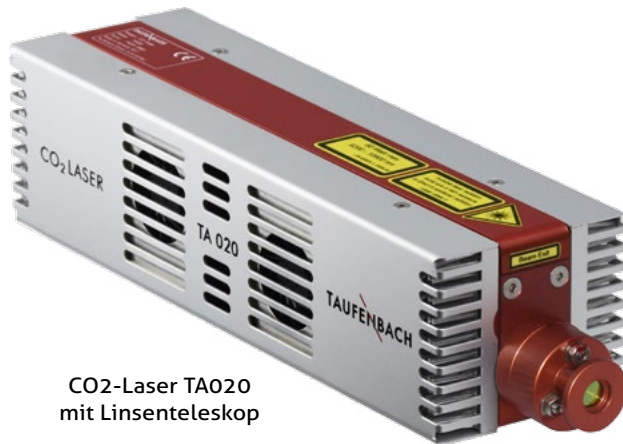
CO 2 -Laser TA020 mit Linsenteleskop